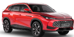
● Diamond Red Metalická farba