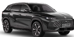
● Pebble Black Metalická farba

*Metalické a trojvrstvové farby sú za príplatok vo výške 600 EUR s DPH