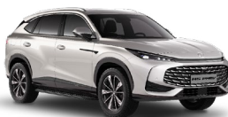
● Sterling Silver Metalická farba