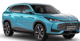
● Arctic Blue Základná farba