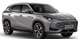
● Hampstead Grey Metalická farba